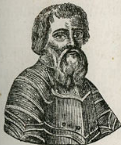
ВЕЛИКІЙ КНЯЗЬ ДМИТРИЙ ІОАННОВИЧЪ ДОНКІЙ СЪ 1363 — ПО 1389 Г.

ДЛЯ ПРИМѢРА, ПРИЛАГАЕМЪ ЗДЕ ВЪНДЪ, ВЕЛИКАГО КНЯ ЗА ДМИТРИА ІВАННО- ДОНІКАГО, СВЩІИ БОГАВШАГО СЪ АТЪС. ПО АТЪС. ГОДЪ.